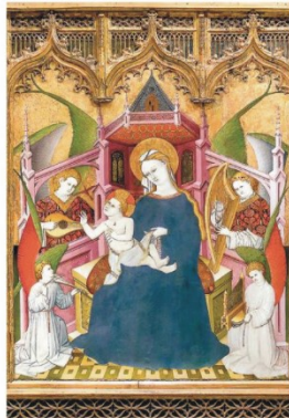
Virgen con el Niño. Tabla central del Retablo de la Vida de la Virgen y de San Francisco. Museo Nacional del Prado. Madrid.